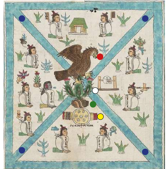
Códice Mendoza, F 2r, 1540.

En el actual escudo nacional, encontramos aún los tres planos cósmicos y se incluyó la serpiente que, según la mitología Nahuatl, representa el poder de la tierra, la fertilidad, la sabiduría, la renovación y el ciclo del eterno retorno: la dualidad vida/muerte. Como Quetzalcóatl, la serpiente emplumada, encarnación entre lo terrenal y lo espiritual.